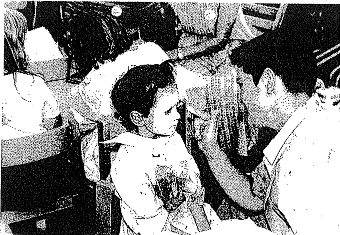
Kinderbetreuung durch die KITA und den Gemeindekindergarten Heckendalheim. Auf unserem Bild das Anlegen einer Gipsmaske.