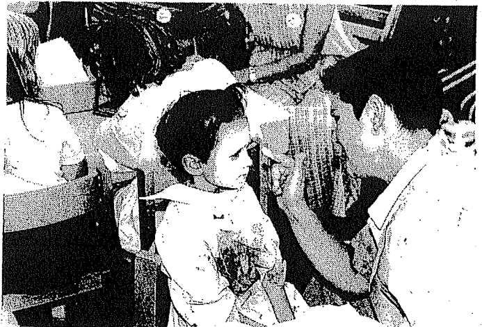
Kinderbetreuung durch die KITA und den Gemeindekindergarten Heckendalheim. Auf unserem Bild das Anlegen einer Gipsmaske.