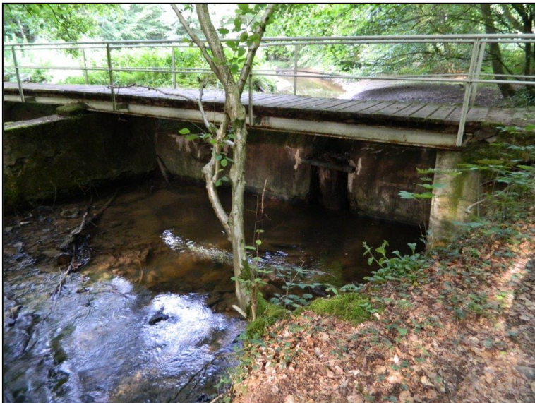
Bild 5: Altes Wehr an der Leuk südlich der Untersten Stegmühle. Ein für die Groppe unüberwindliches Hindernis.