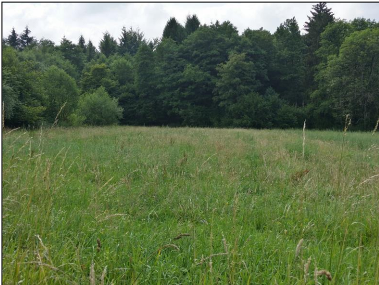
Bild 8: Brachliegendes Grünland im westlichen Offenlandbereich an der Leuk. Die kurzzeitige Brache ist als Fortpflanzungshabitat des Feuerfalters ( Lycaena dispar) gut geeignet.