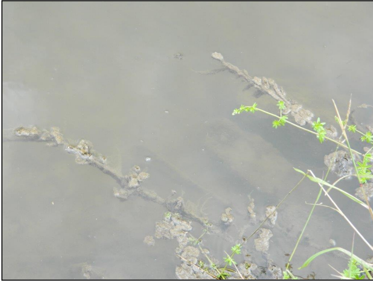
Bild 7: Leuk am westlichen Eintritt in das Schutzgebiet. Das trübe Wasser mit hoher Sedimentfracht ist reich an Nährstoffen.