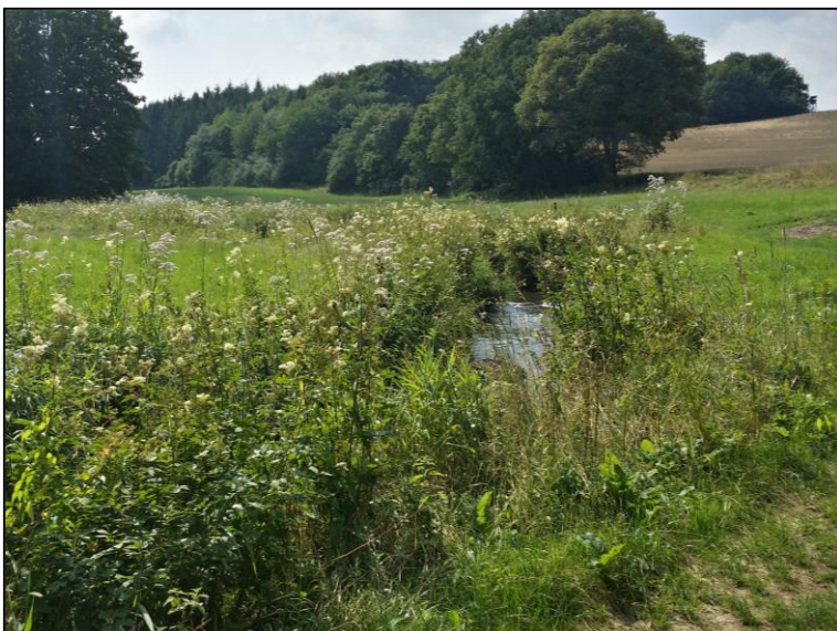
Bild 6: Naturnaher Leukverlauf im Offenland mit sehr schmaler Hochstaudenflur (kein FFH-LRT). Gewässer in diesem Bereich mit Gewöhnlichem Quellmoos ( Fontinalis antipyretica) und als LRT 3260 erfasst.