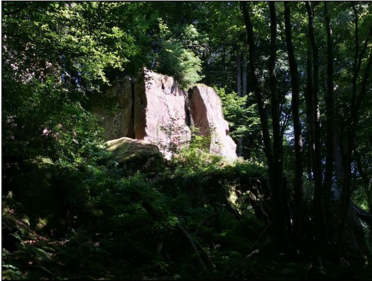
Bild 10: Felsbereich an den Hängen des Leuktales, nördlich der Untersten Stegmühle. Der Lebensraumtyp 8220 wurde hier neu erfasst. Der Fels hat viele Spalten und kleine Höhlungen, die auch potentielle Fledermaus-Quartiere darstellen.