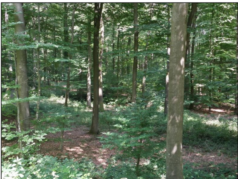
Bild 2: Hainsimsen-Buchenwald der Erhaltungsstufe B.