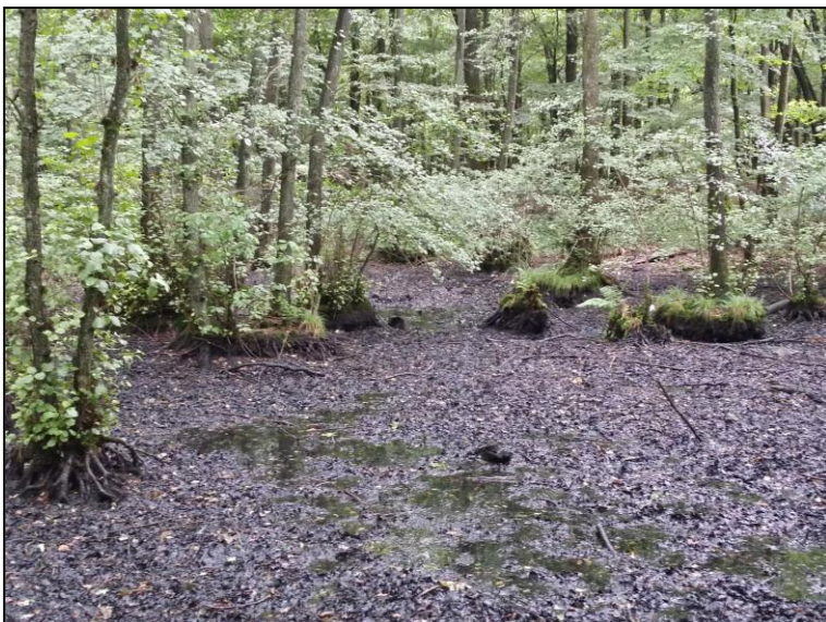
Bild 12: Fragmentarischer Erlen-Bruchwald in einer verlandeten Mardelle im Waldgebiet Oberhardt bei Faha. Angrenzend Eichen-Hainbuchenwald (LRT 9160).