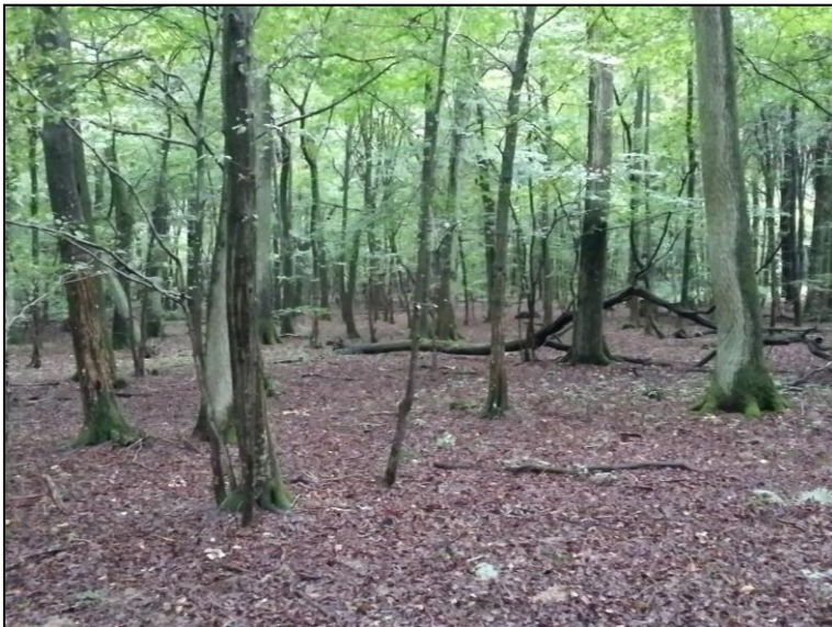
Bild 11: Eichen-Hainbuchenwald (LRT 9160, Erhaltungsstufe B) im Waldgebiet Oberhardt bei Faha.