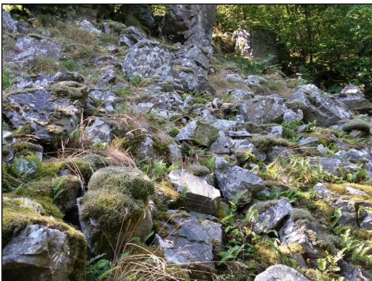
Bild 9: Natürliche Silikat-Blockhalde am Krautfelsen. Als Lebensraumtyp 8150 mit Erhaltungsstufe A erfasst. Im Hintergrund schließt am oberen Rand der LRT 8220 (Erhaltungsstufe B) an.