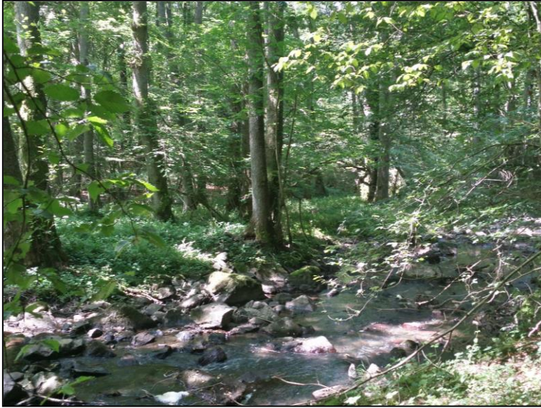
Bild 4: Leuk mit angrenzendem Auwald (LRT *91E0) der Erhaltungsstufe B im Bereich der Oberen Stegmühle. Blockreicher, naturnaher Fließgewässerverlauf mit Vorkommen der Rotalge Hildenbrandia rivularis.