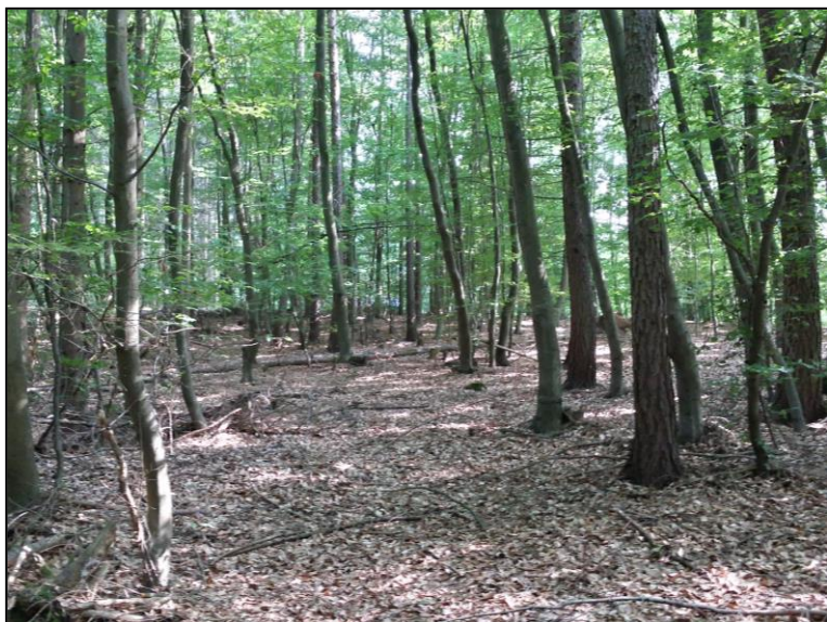
Bild 1: Hainsimsen-Buchenwald der Erhaltungsstufe C. Lärchen ( Larix decidua) sind dem Buchenbestand beigemischt.