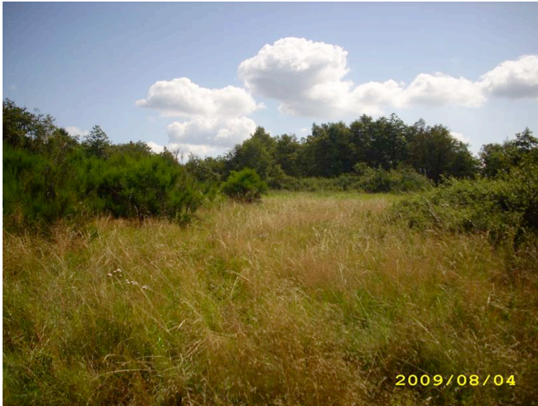
Abb. 6: Der brachgefallene Bereich der Flachlandmähwiese mit z.T. fortgeschrittener Verbuschung.