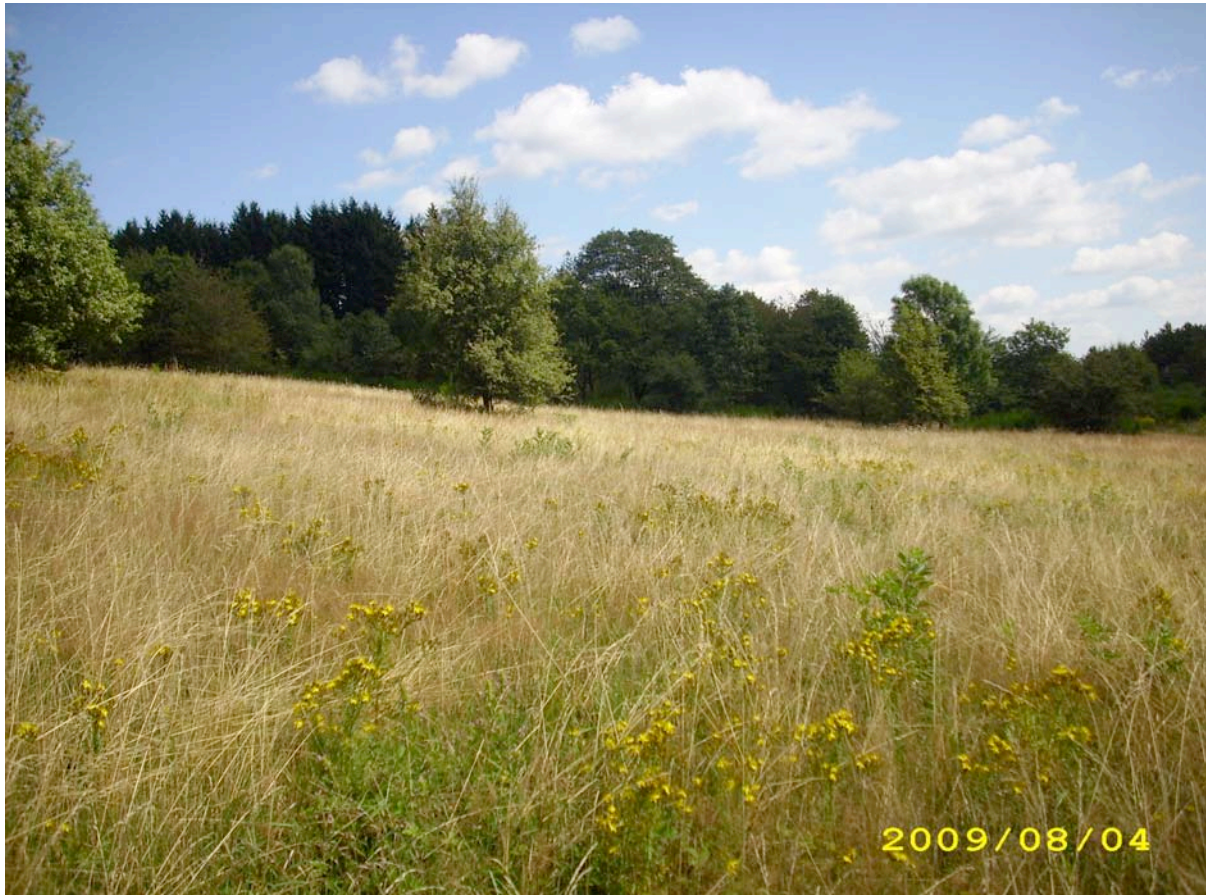
Abb. 7: Wiesenbrache am Südrand des Projektgebietes mit gelbem Blühaspekt von Tüpfel-Hartheu ( Hypericum perforatum ).