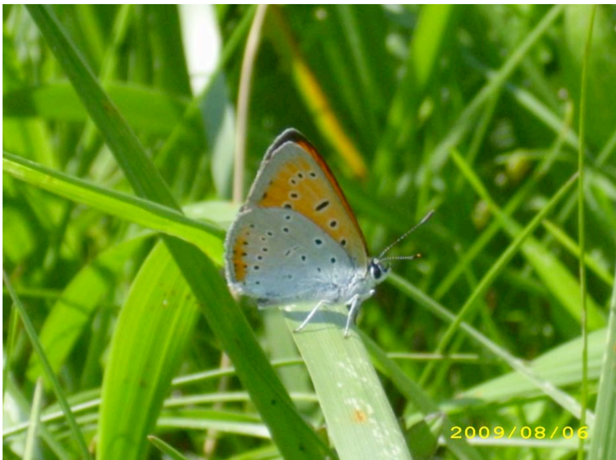
Abb. 13: Der Große Feuerfalter ( Lycaena dispar ).

Zu Ökologie und Schutz des Großen Feuerfalters im Saarland siehe insbesondere GRÜNFELDER 2008, vergleiche auch die Verbote und Regelungen für die Art 1060 Lycaena dispar im Verordnungsentwurf für die saarländischen NATURA 2000-Schutzgebiete (MINISTERIUM FÜR UMWELT 2009).