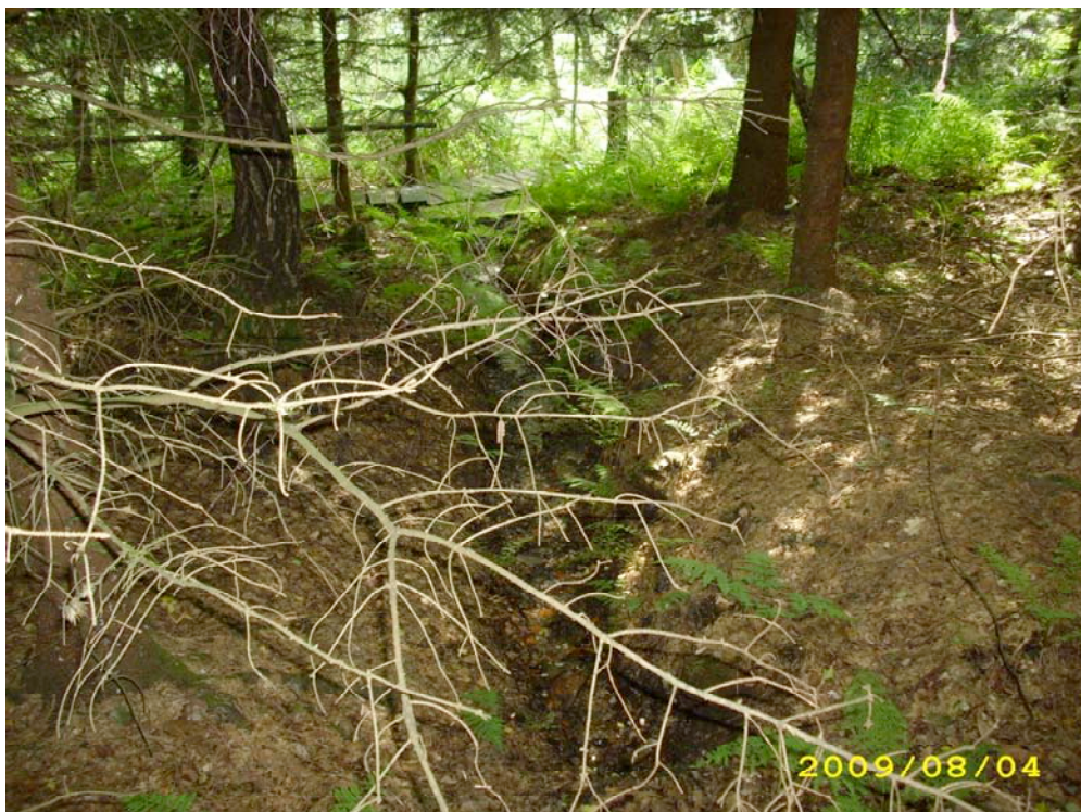
Abb. 12: Entwässerungsgraben am Rande des Birken-Bruchwaldes.

Während der wärmeliebende Traubeneichenwald sich in einem Stadium weitgehend ungestörter Sukzession befindet, ist der Bruchwald durch einen Entwässerungsgraben und eine im unmittelbaren Umfeld platzierte Hütte anthropogen beeinflusst. Für den Entwässerungsgraben war im Gelände nicht ersichtlich, ob er auf den Bruchwald entwässernd wirkt oder aber ihm aus der Umgebung Wasser zuführt.