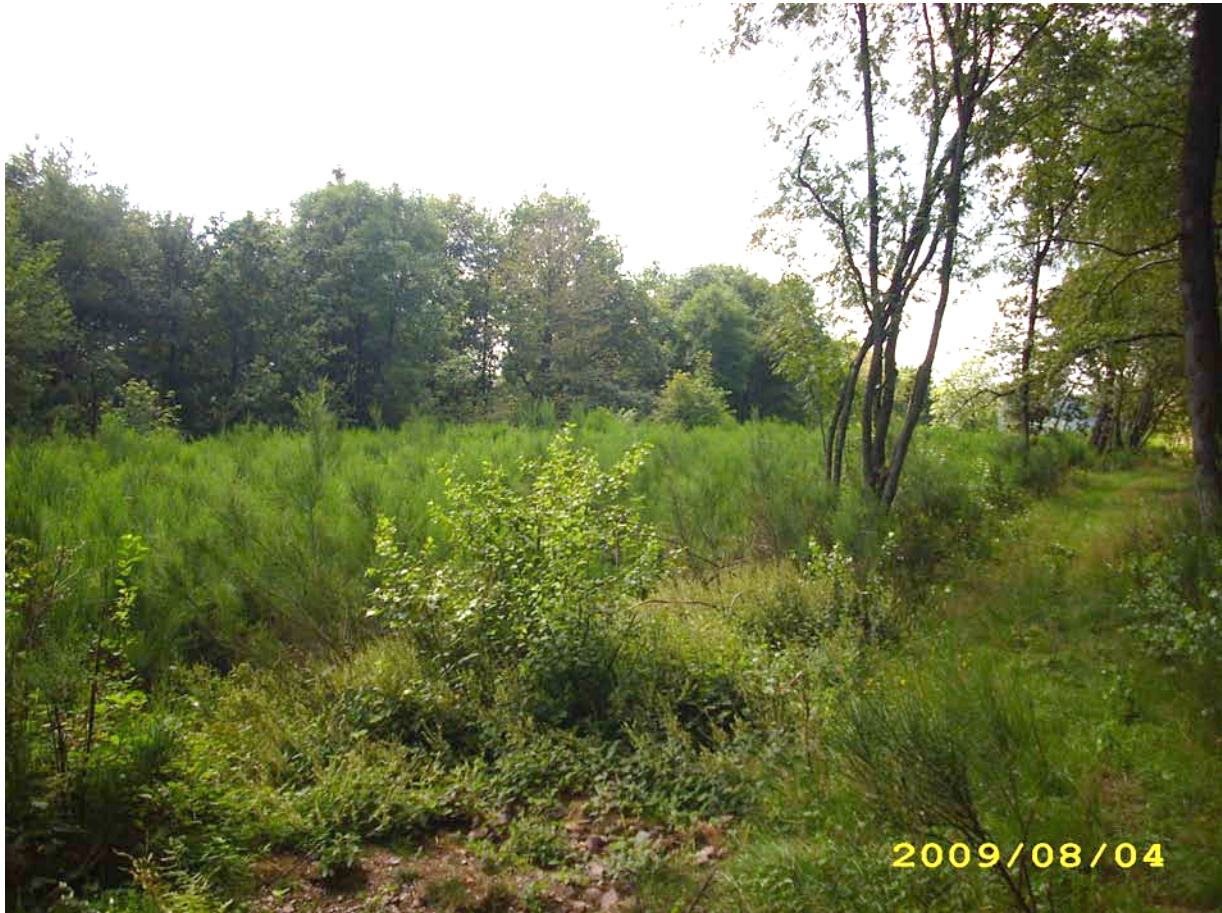
Abb. 9: Besenginsterflur im Bereich einer Waldschneise am Südostrand des FFH-Gebietes.