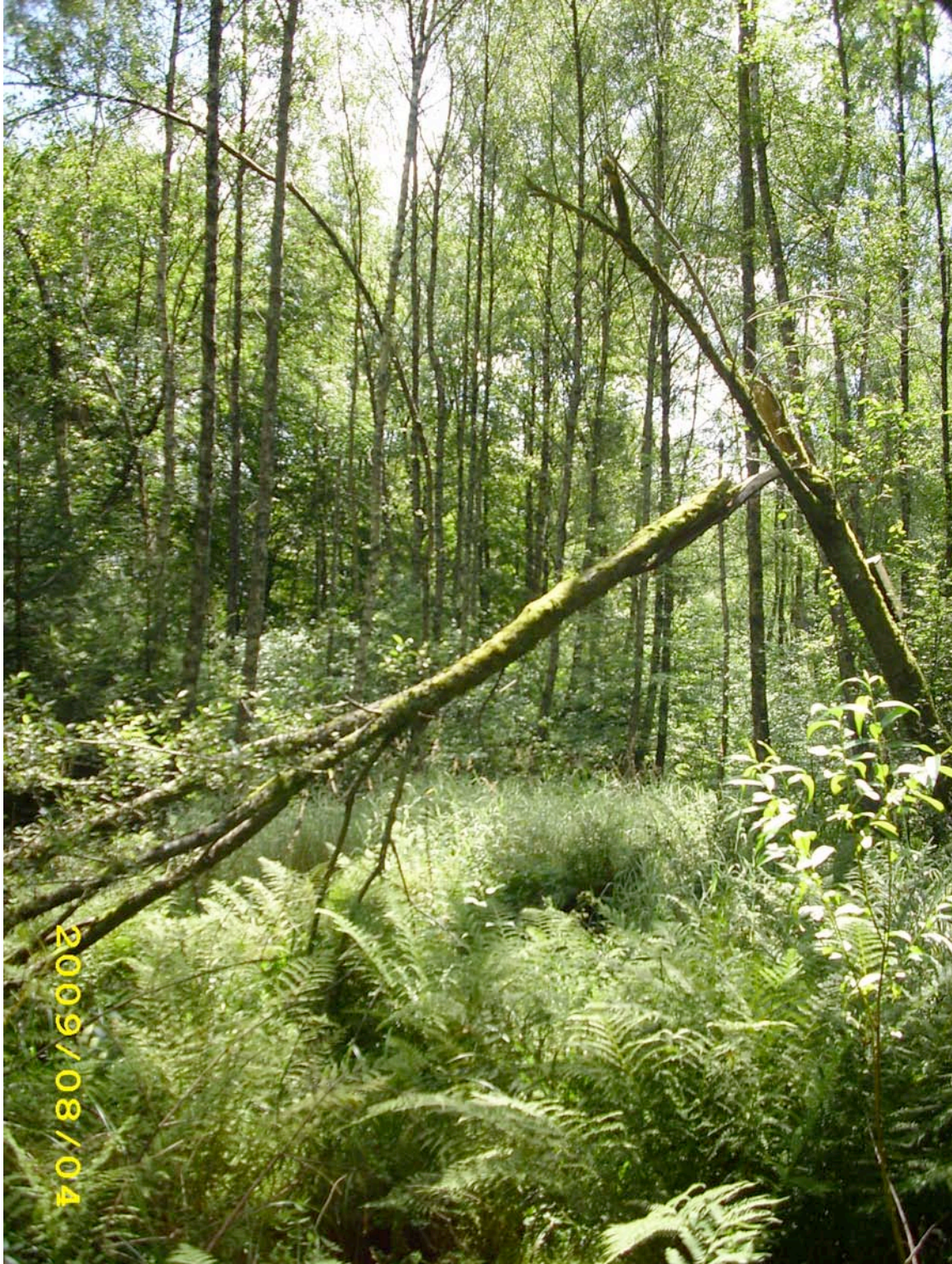
Abb. 11: Blick in den Hängebirken-Sumpfwald mit dominanter Sumpfschge ( Carex acutiformis ) und Breitblättrigem Dornfarn ( Dryopteris dilatata ) in der Feldschicht.

Im Nordosten des FFH-Gebietes befindet sich im Bereich eines Quellsumpfes ein von Vorwald umgebenes Bruchwäldchen mit Dominanz der Hängebirke u.a. mit Waldsimse im Unterwuchs.