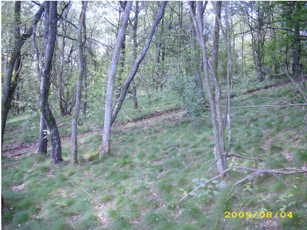
Abb. 10: Blick in den wärmeliebenden Traubeneichen-Vorwald mit Dominanz der Drahtschmiele ( Avenella flexuosa ) in der Feldschicht.

Elemente der Heiden, deren Vorkommen als relictär zu werten ist. Die Fläche war ursprünglich vermutlich flächendeckend mit Calluna-Heide bedeckt.