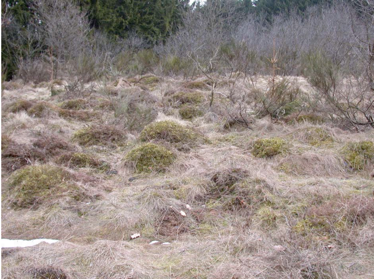
Abb. 12: Initial verbuschte Zwergstrauchheide am Peterberg, vorgesehen als Spenderfläche für Calluna-Heidenentwicklung.