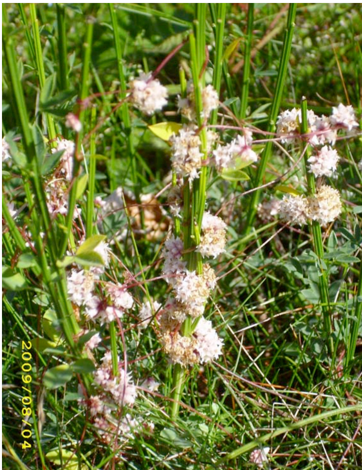
Abb. 4: Exemplar der Quendelseide ( Cuscuta epithymum ) an Besenginster auf der kleineren der beiden Besenheideflächen.