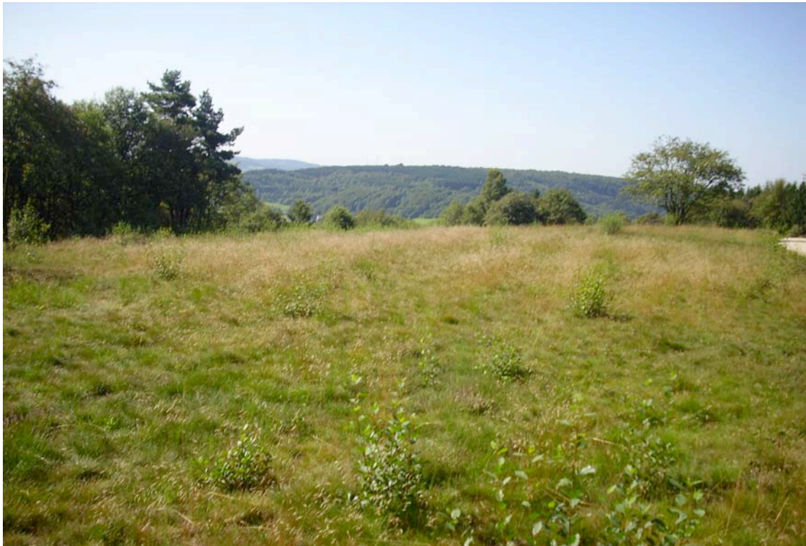
Abb. 3: Die größere der beiden hochwertigen Besenheidebestände im zentralen Bereich des Projektgebietes mit Eindringen von Faulbaum ( Frangula alnus ) und mäßiger Vergrasung (v.a. durch Avenella flexuosa ).