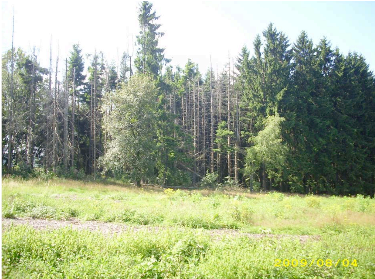
Abb. 8: Im Bildvordergrund eine größere Schlagflur auf einer vormals mit Nadelforstkulturen bestockten Fläche im zentralen Bereich des FFH-Gebietes (Kompensationsfläche im Rahmen der Flurbereinigung). Im Hintergrund ein durch Borkenkäferbefall stark geschädigter Nadelholzbestand.