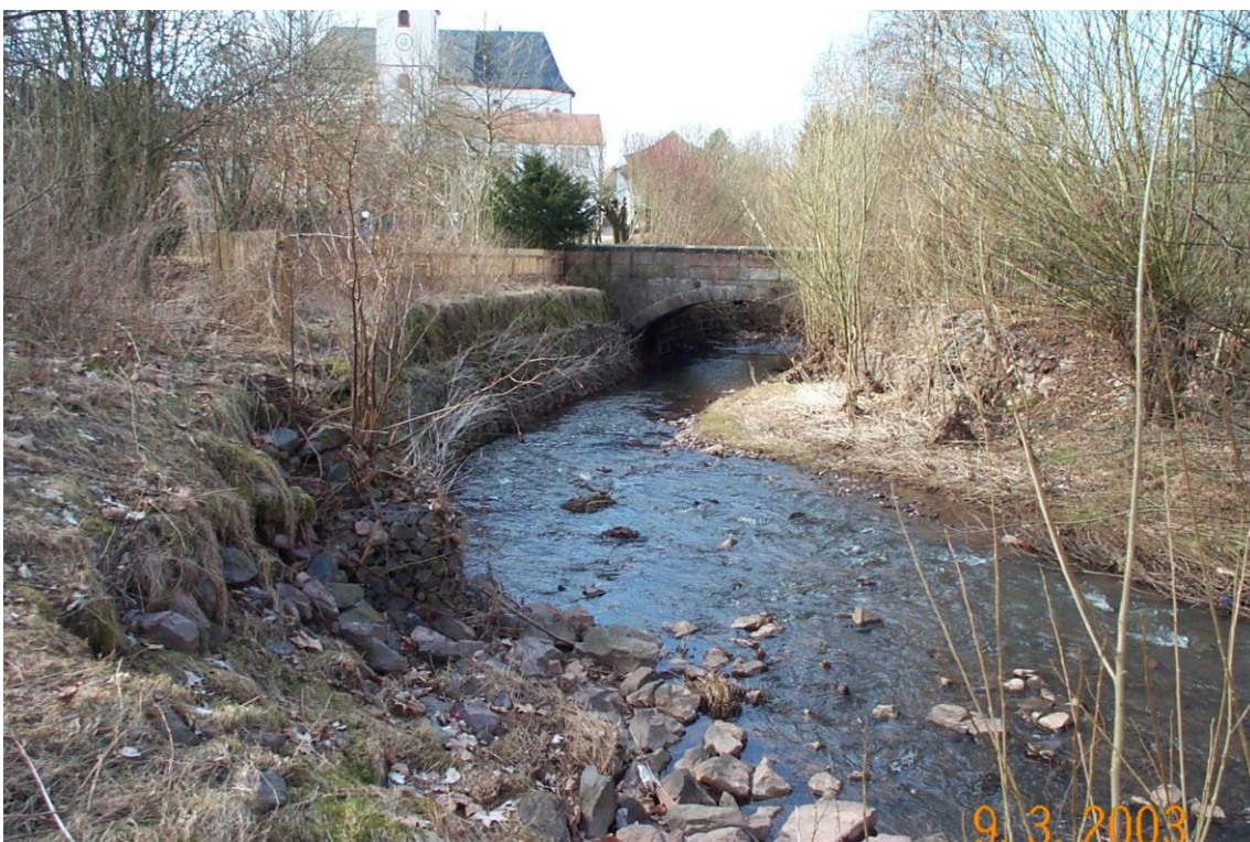
Festplatz Illingen, Zustand 2003