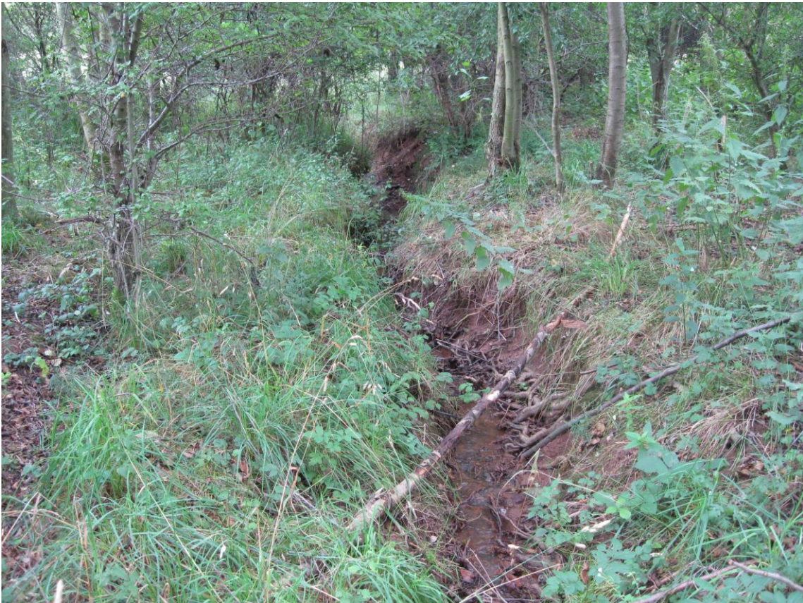
Harzbach Bachlauf mit Gehölzbestand 2011