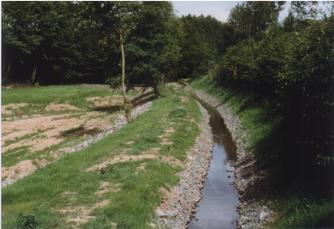
Ahlenbach: Verlegung des Teiches in den Nebenschluss (2000)