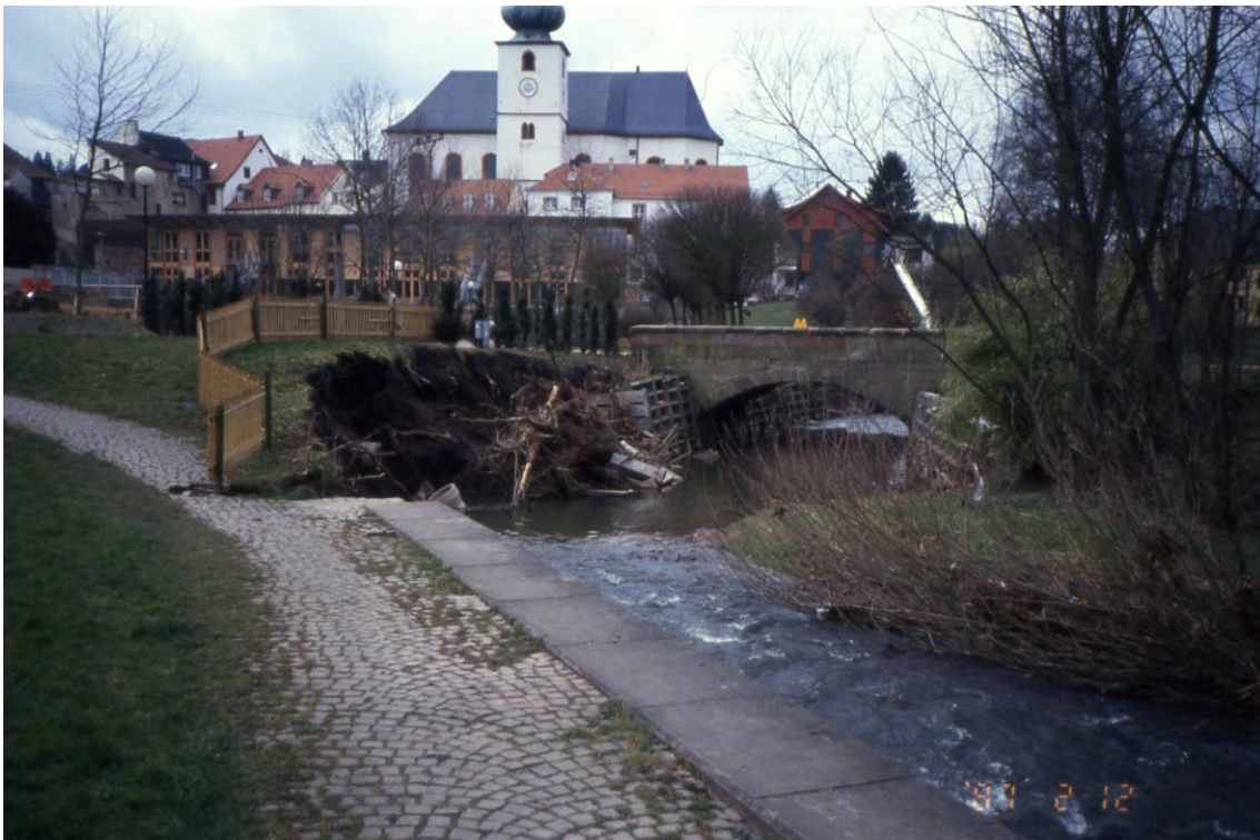
Festplatz Illingen: Ufermauer 1994