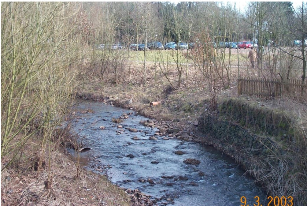
Festplatz Illingen, Zustand 2003