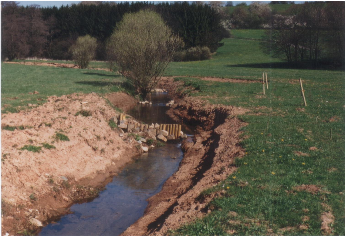
ILL unterhalb Urexweiler: Renaturierter Bachlauf mit Strömungsablenkern 1998