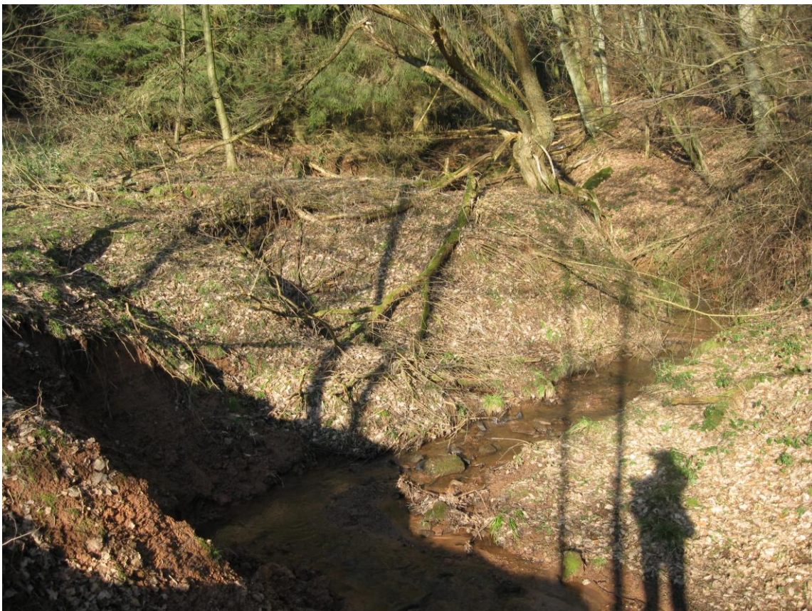
Sulbach. Aktueller Zustand 2011, stabilisiertes Bachbett nach Auszäunen