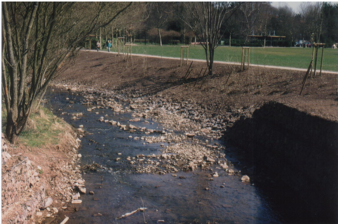
Festplatz Illingen, Umgestaltung 1998