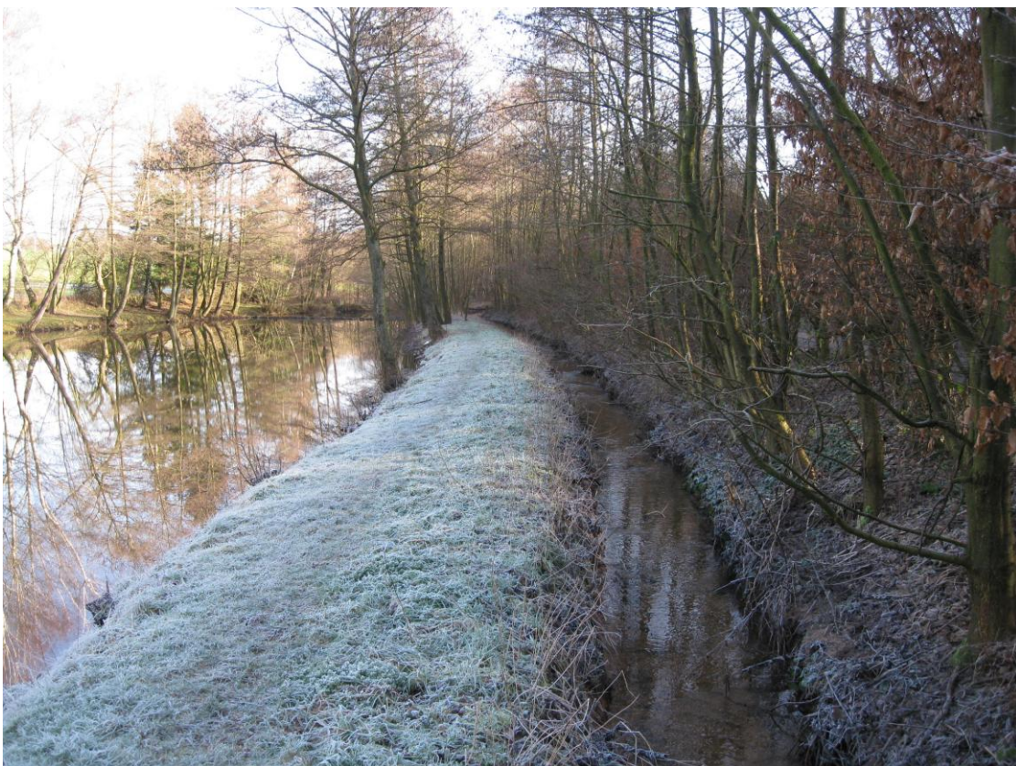
Ahlenbach: Aktueller Zustand 2011