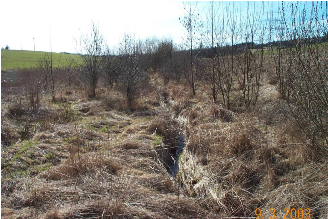
Harzbach: brachgefallener Acker mit Bachlauf im Jahr 2003