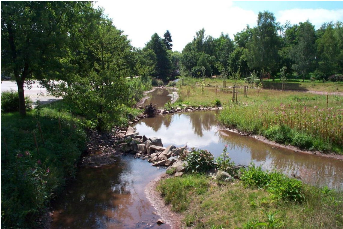
ILL in der Ortsmitte Dirmingen, Renaturierung 2001