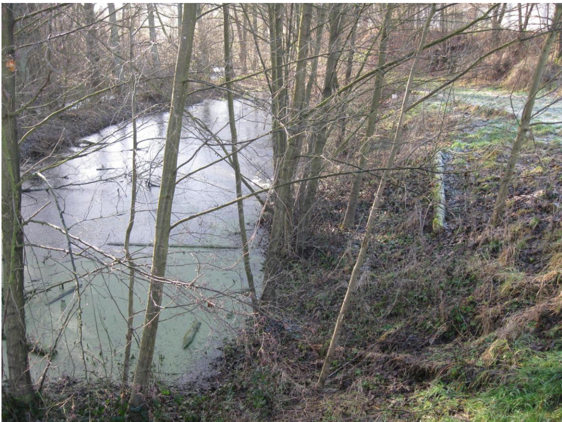
Alsbach bei Marpingen, Zustand 2011