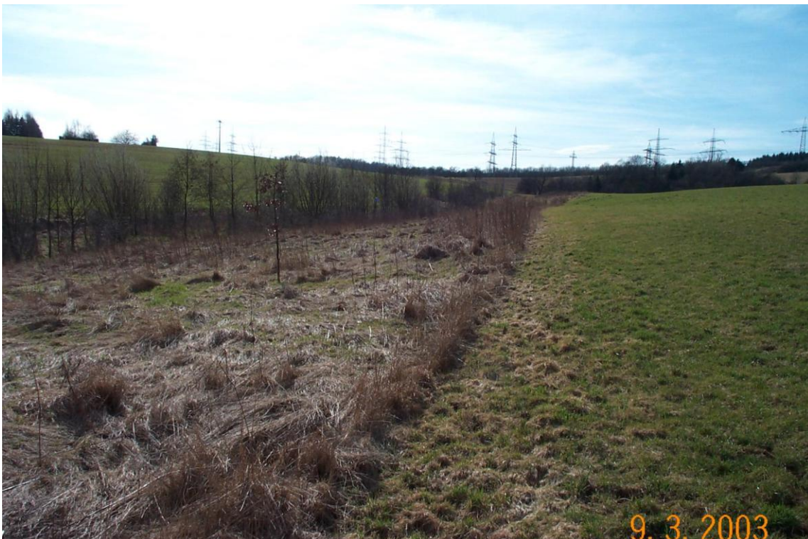
Harzbach: Entwicklung auf dem umgewandelten Acker bis zum Jahr 2003