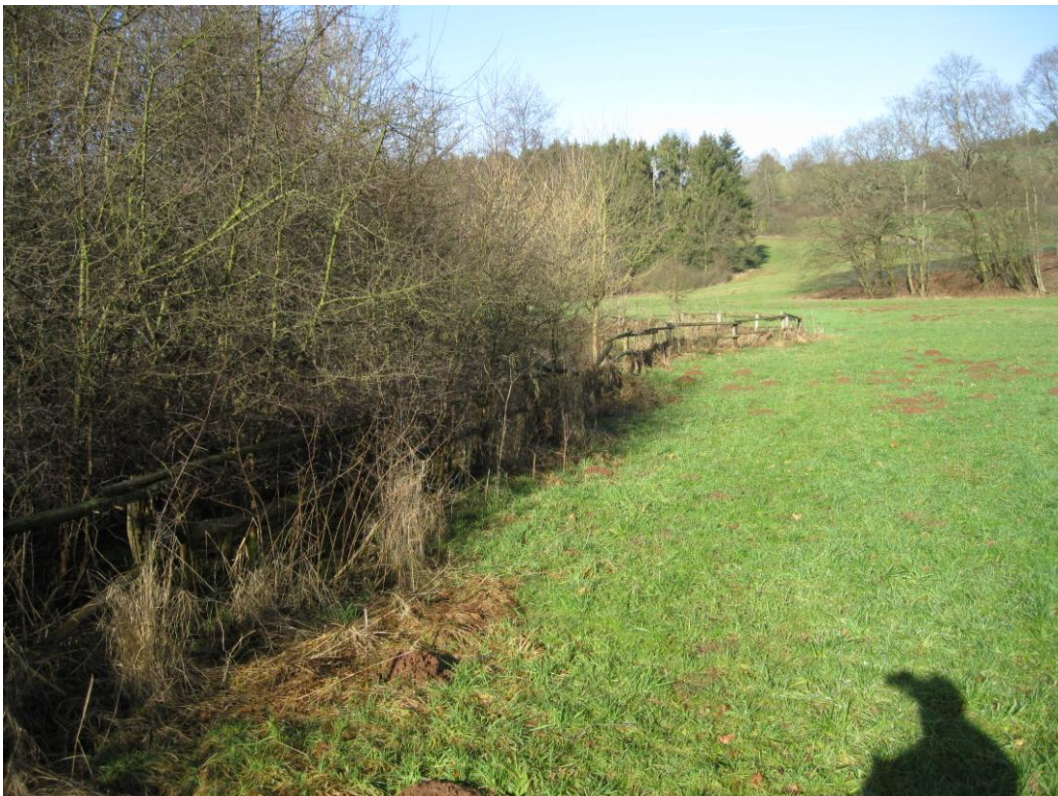
ILL unterhalb Urexweiler: Renaturierter Bachlauf 2011 mit Gehölzufersaum