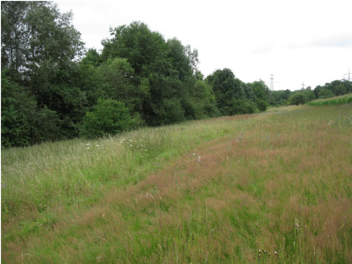
Harzbach: Aktueller Zustand 2011 mit Gehölzufersaum und Grünlandbrache