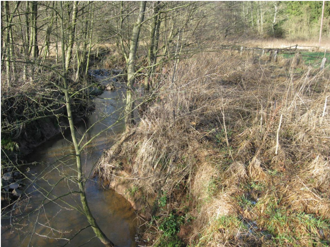
ILL südlich Urexweiler: Gehölzufersaum 2011