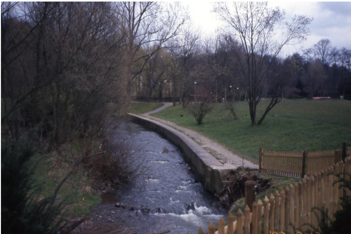
Festplatz Illingen: Ufermauer 1994