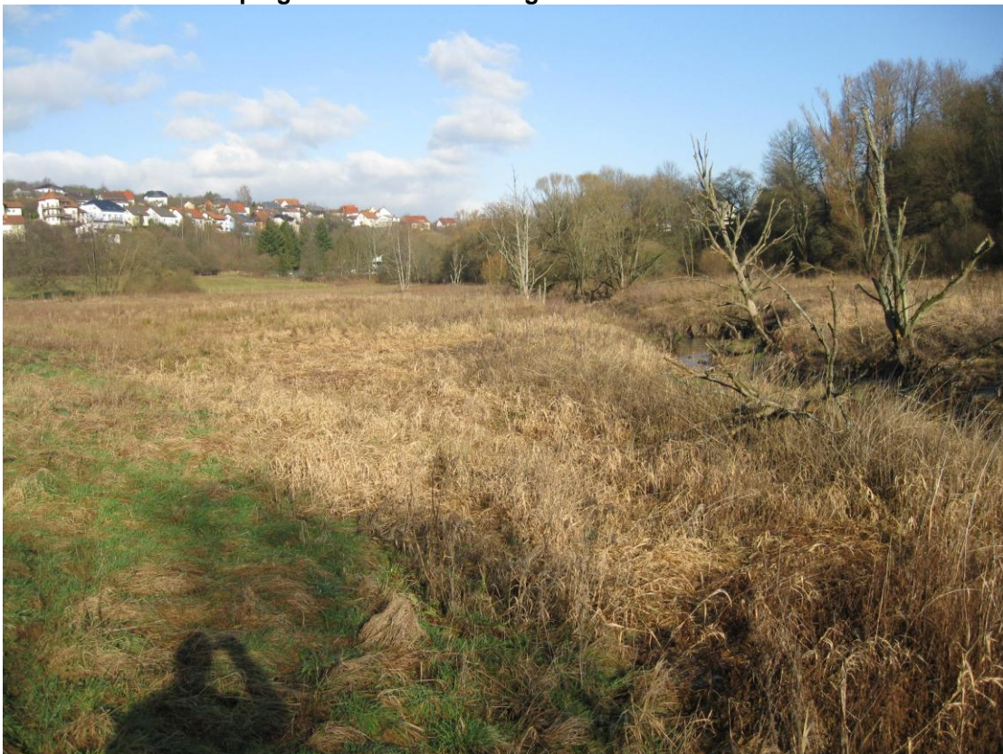
Alsbach südlich Marpingen, brachliegende Talaue 2011