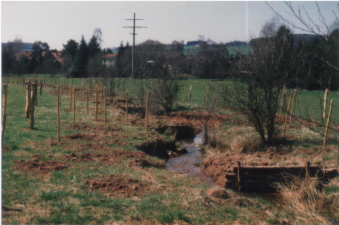
Ahlenbach: Renaturierung und Gehölzpflanzung 1996