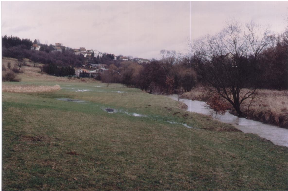
Alsbach südlich Marpingen: Grünlandnutzung 1995