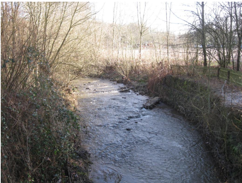
Festplatz Illingen, Zustand 2011