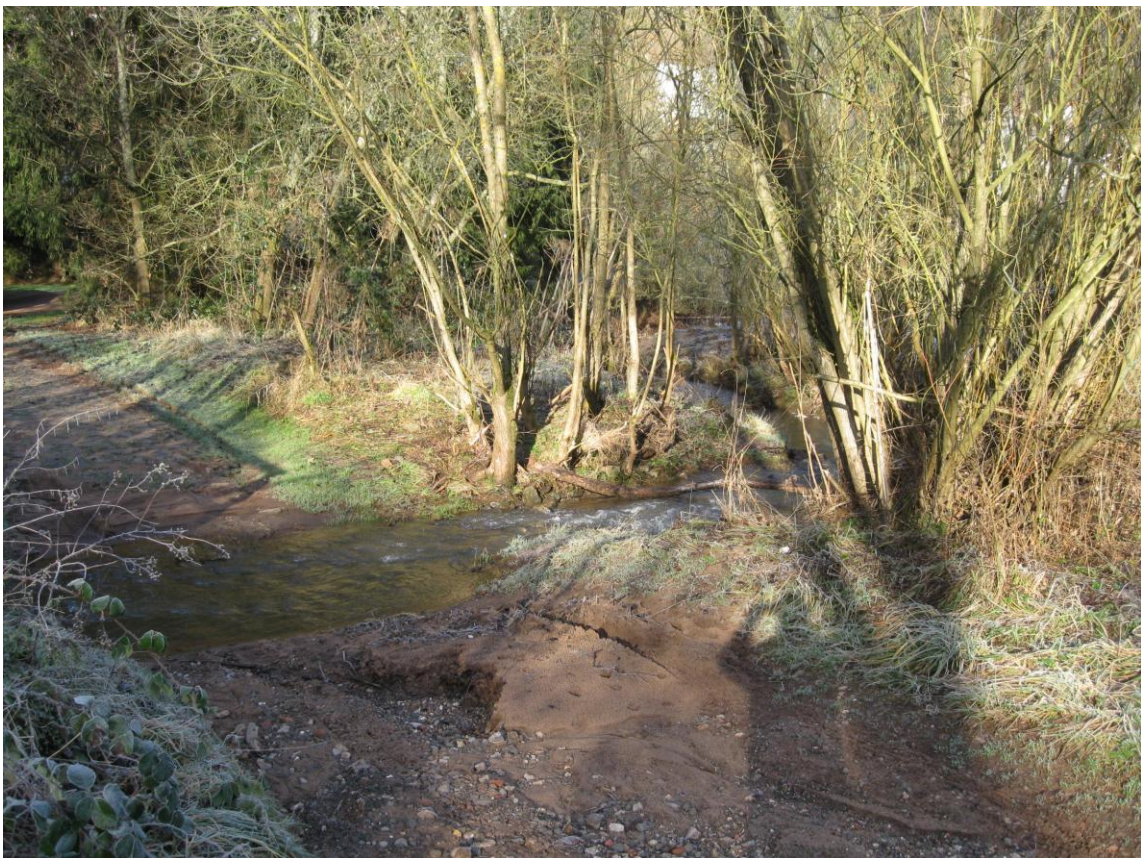
Furt am Wiesbach: Aktueller Zustand 2011