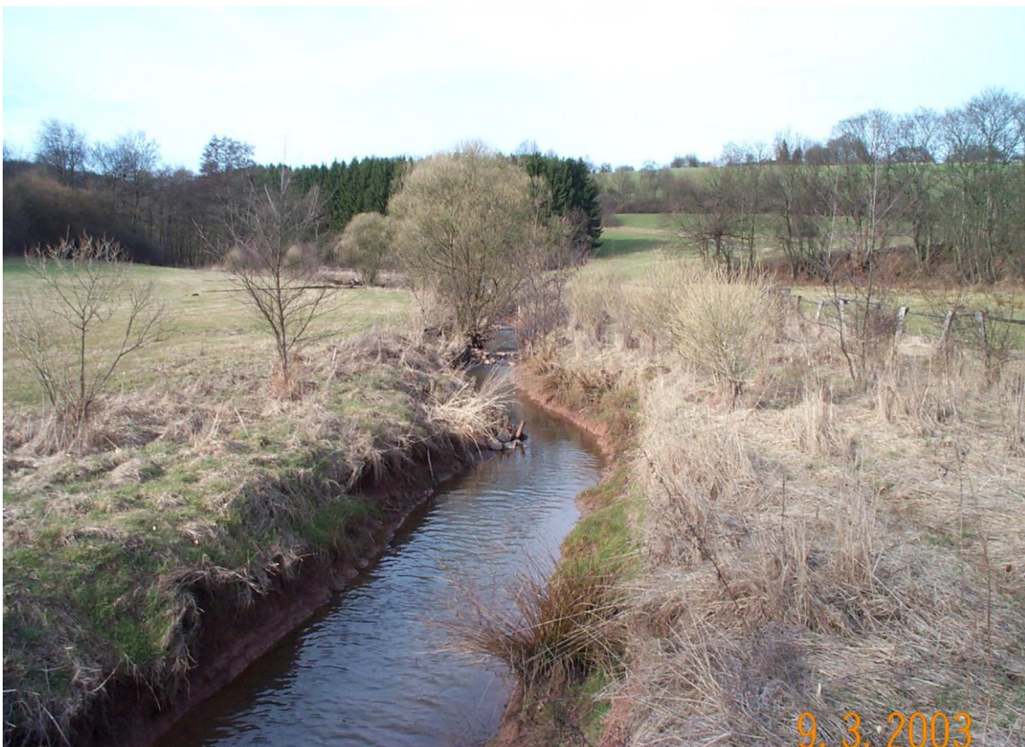
ILL unterhalb Urexweiler: Renaturierter Bachlauf nach 5 Jahren (2003)