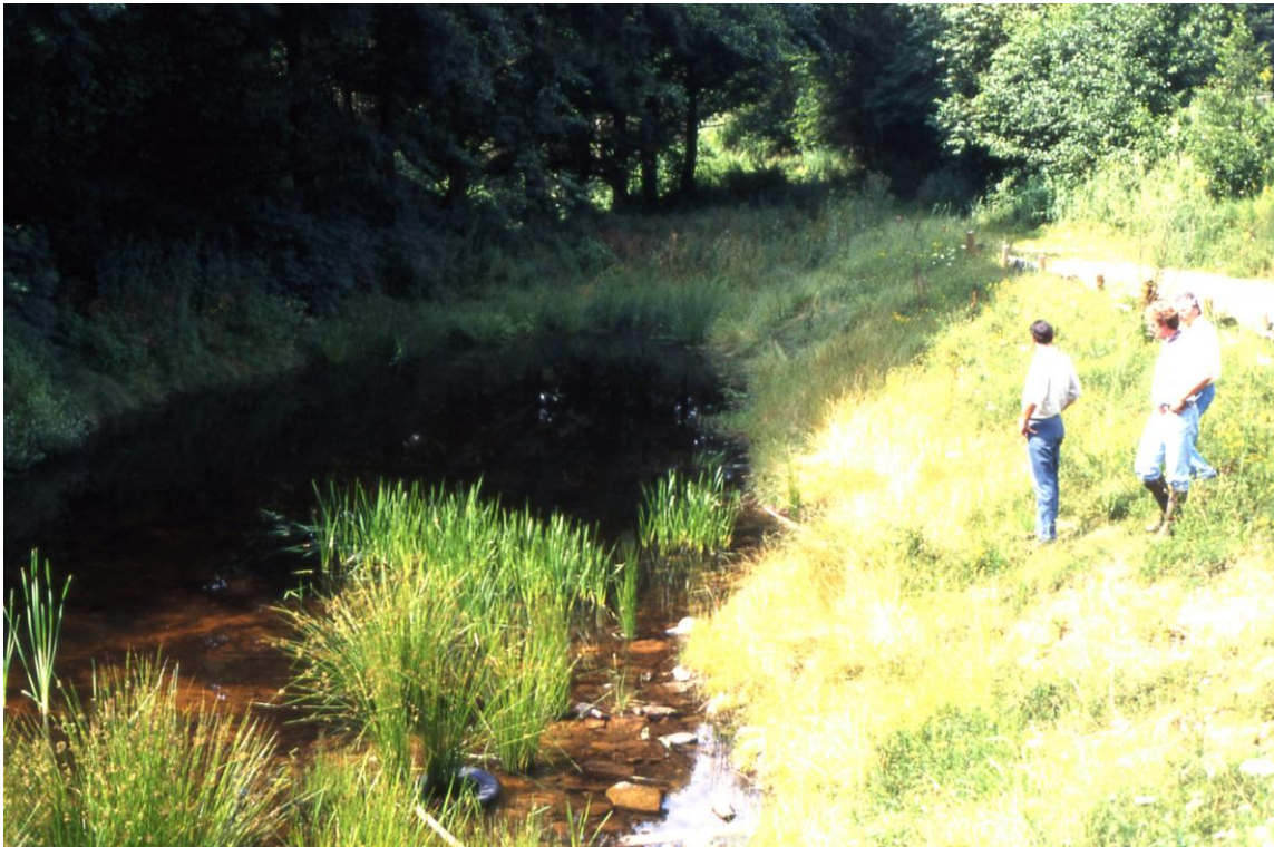
Alsbach bei Marpingen, Flutmulde 2000