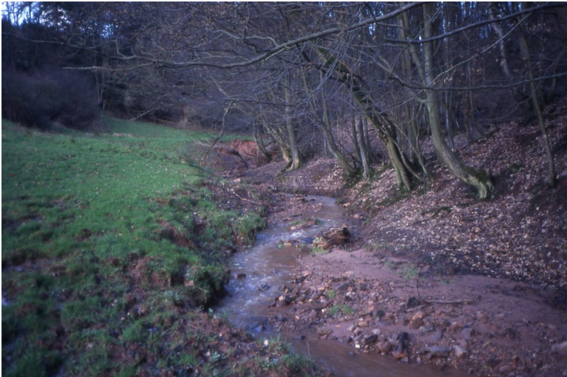
Sulbach 1994: starke Schäden durch Viehtritt