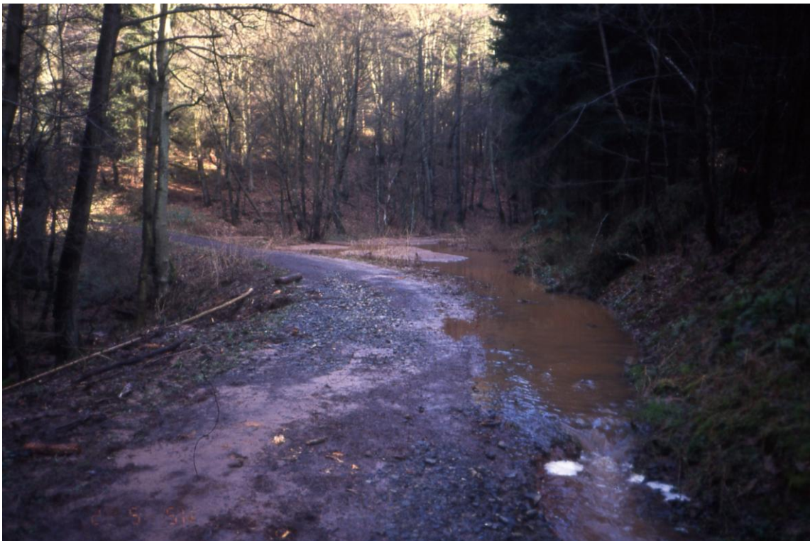
Waldweg am Sulbach mit nicht funktionstüchtiger Verrohrung 1994