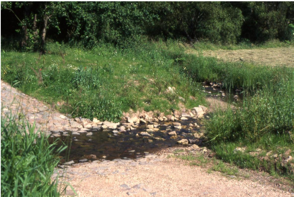
Furt am Wiesbach 1998