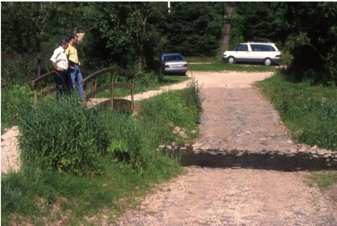
Neubau einer Furt am Wiesbach 1998