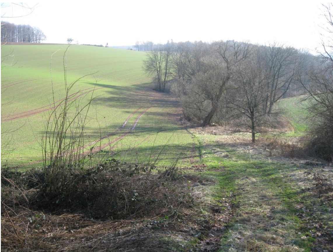
Sulbach: aktueller Zustand 2011, keine Veränderung