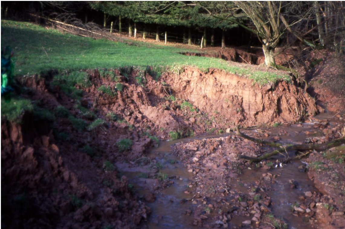
Sulbach 1994: starke Erosion durch Viehtritt