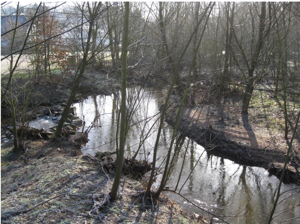
ILL in der Ortsmitte Dirmingen, aktueller Zustand 2011