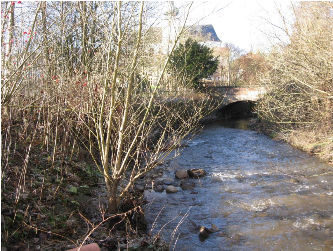
Festplatz Illingen, Zustand 2011