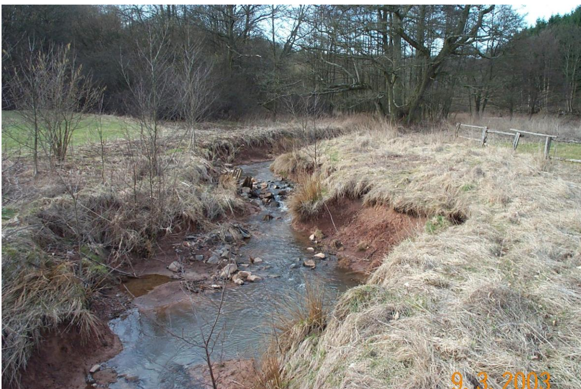
ILL südlich Urexweiler: eigendynamischer Bachlauf 2003