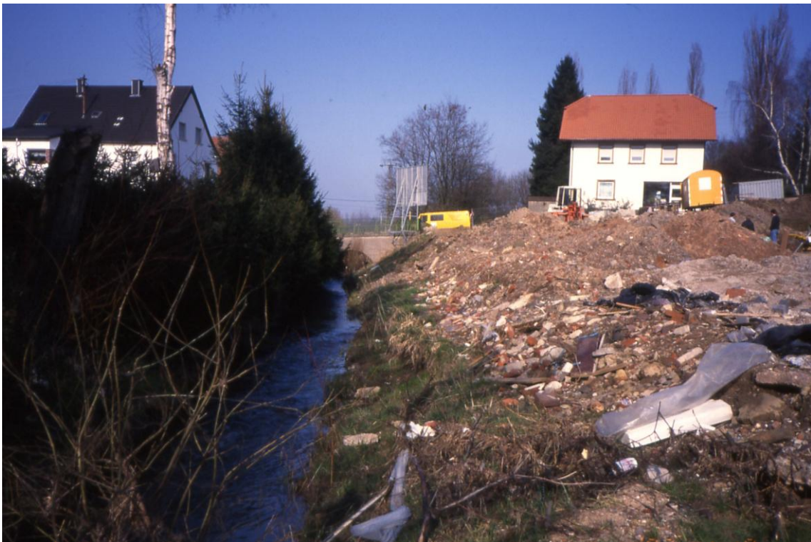
Alsbach: Ortsmitte Marpingen, Beseitigung einer Aufschüttung 1995