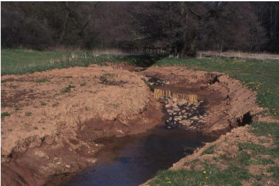
ILL südlich Urexweiler: Renaturierung 1998