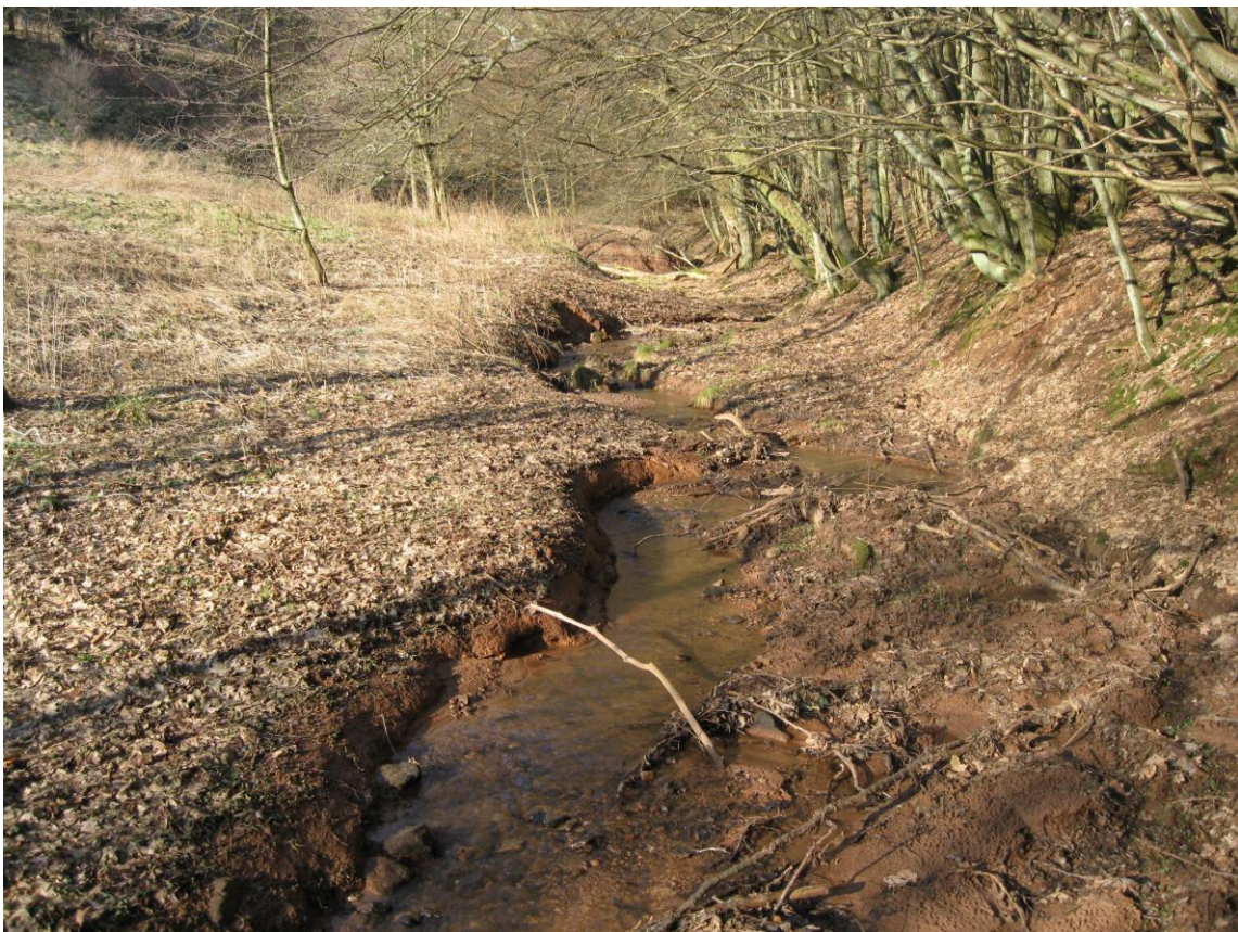
Sulbach: aktueller Zustand: naturnaher Bachlauf nach dem Auszäunen