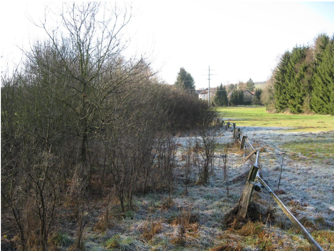
Ahlenbach: Aktueller Zustand 2011