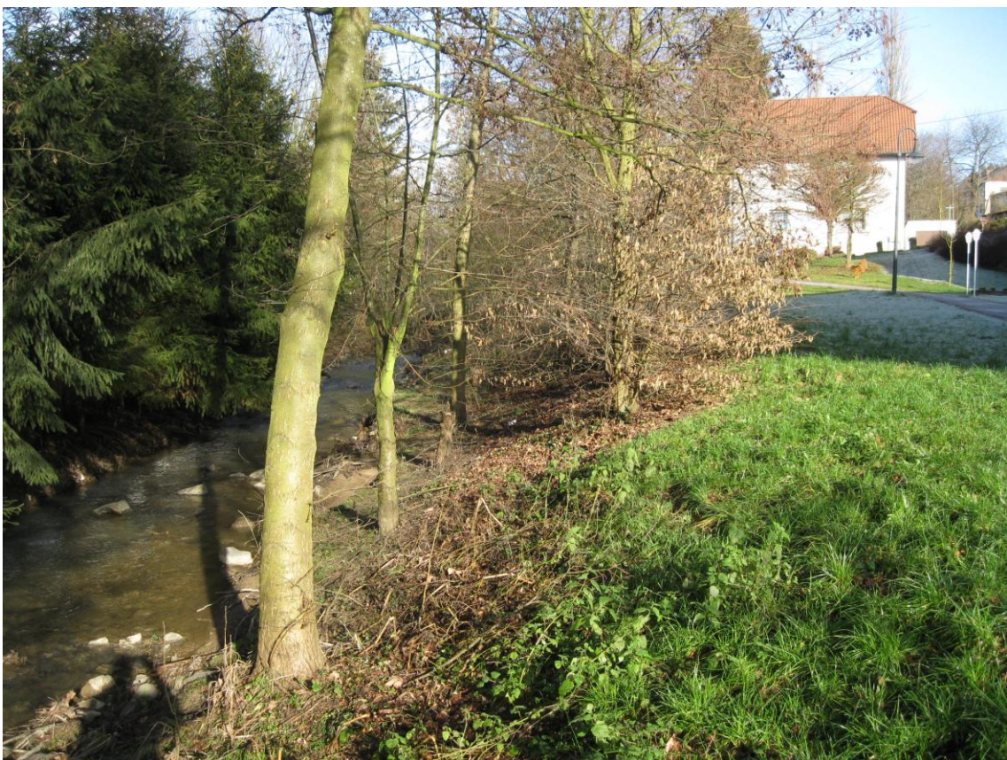
Alsbach, Ortsmitte Marpingen: aktueller Zustand 2011