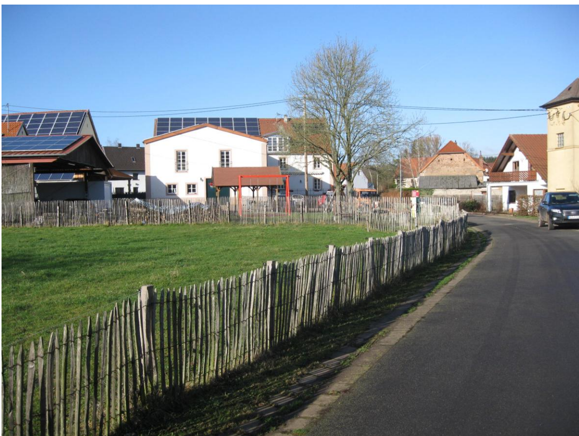
Aktueller Zustand 2011