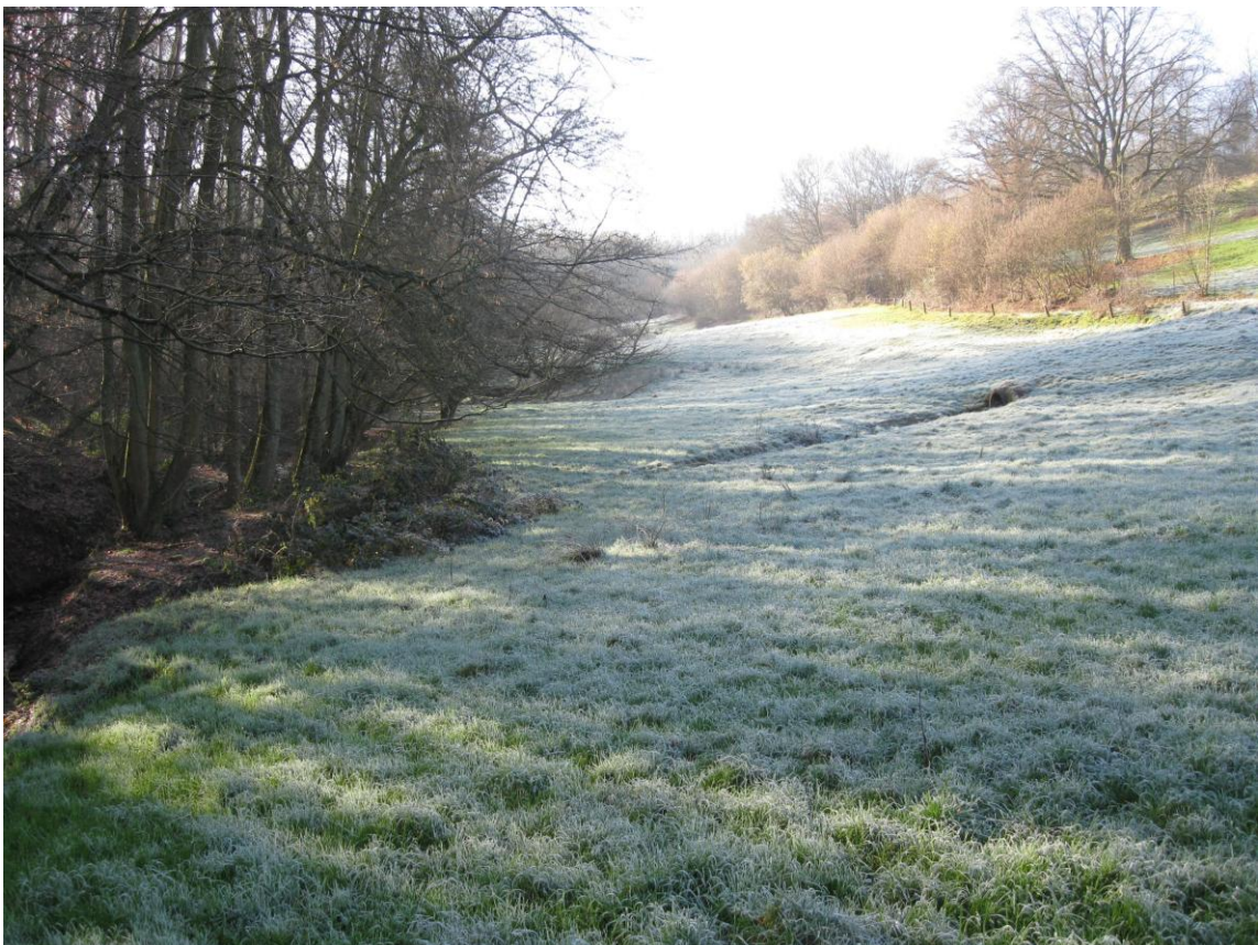
Ellmachersbach, aktueller Zustand 2011, keine Veränderung