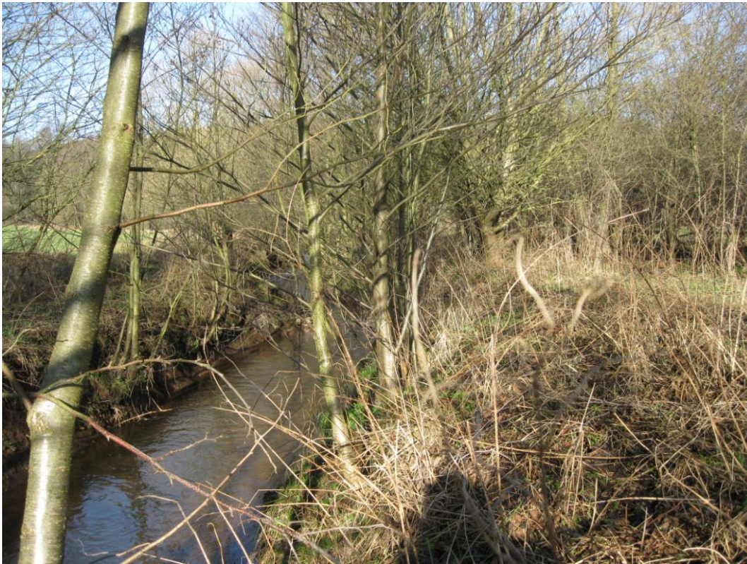
ILL unterhalb Urexweiler: Renaturierter Bachlauf 2011 mit Gehölzufersaum