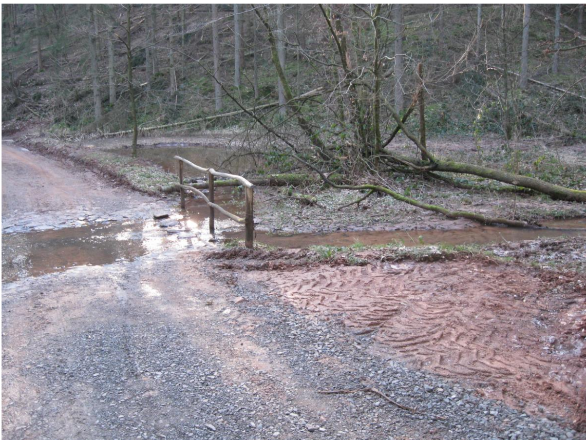
Waldweg am Sulbach nach dem Bau einer Furt 2011