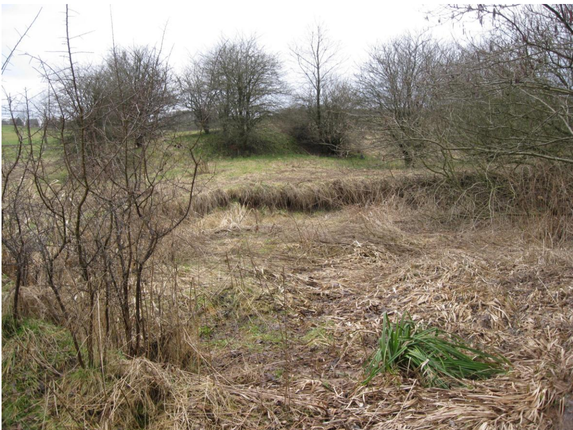
Merch: aktueller Zustand 2011, Verlagerung des Bachlaufs