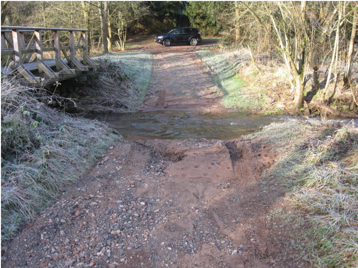
Furt am Wiesbach: Aktueller Zustand 2011