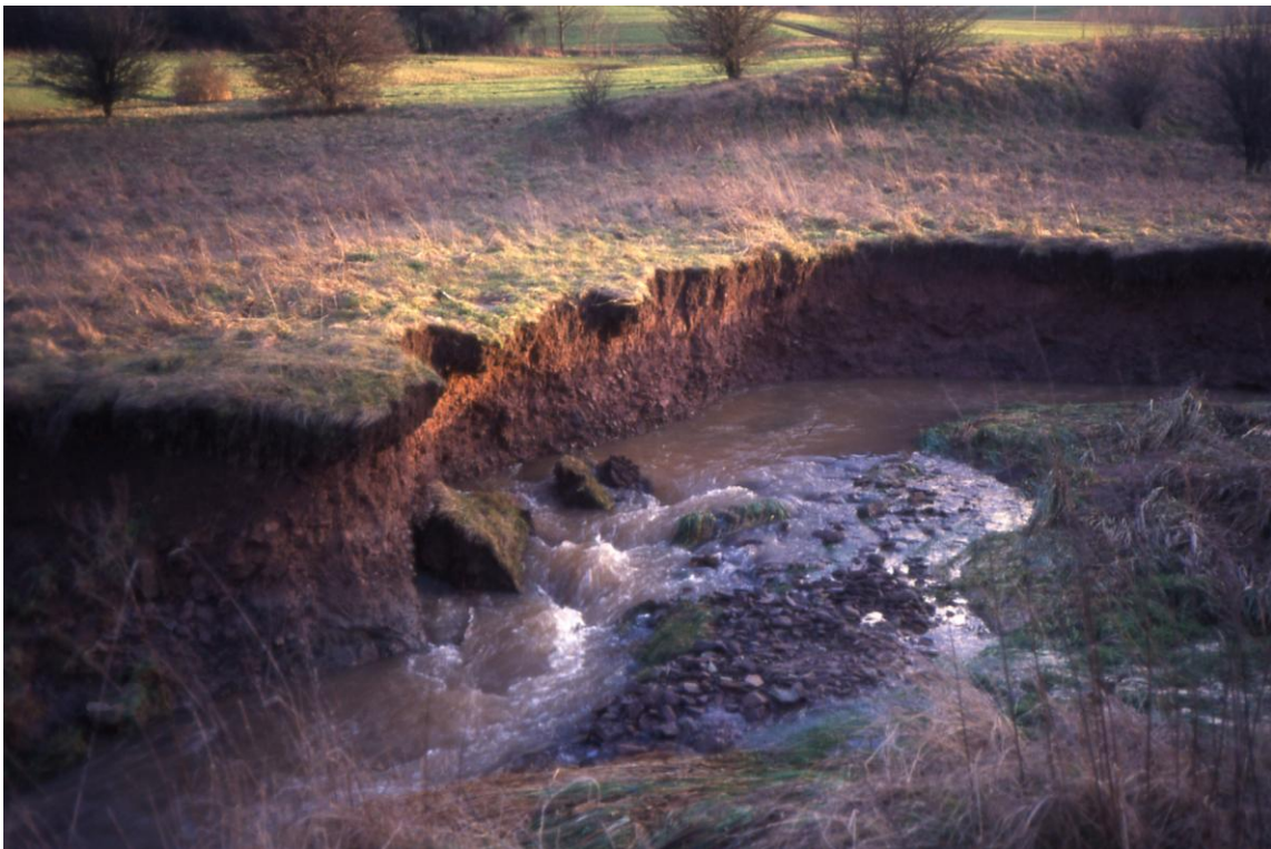
Merch: starke Seiten- und Tiefenerosion 1994