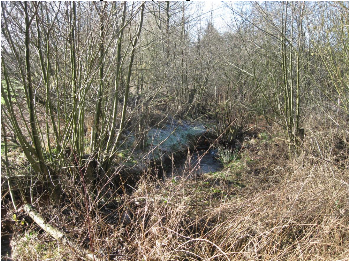
Ahlenbach: Aktueller Zustand 2011