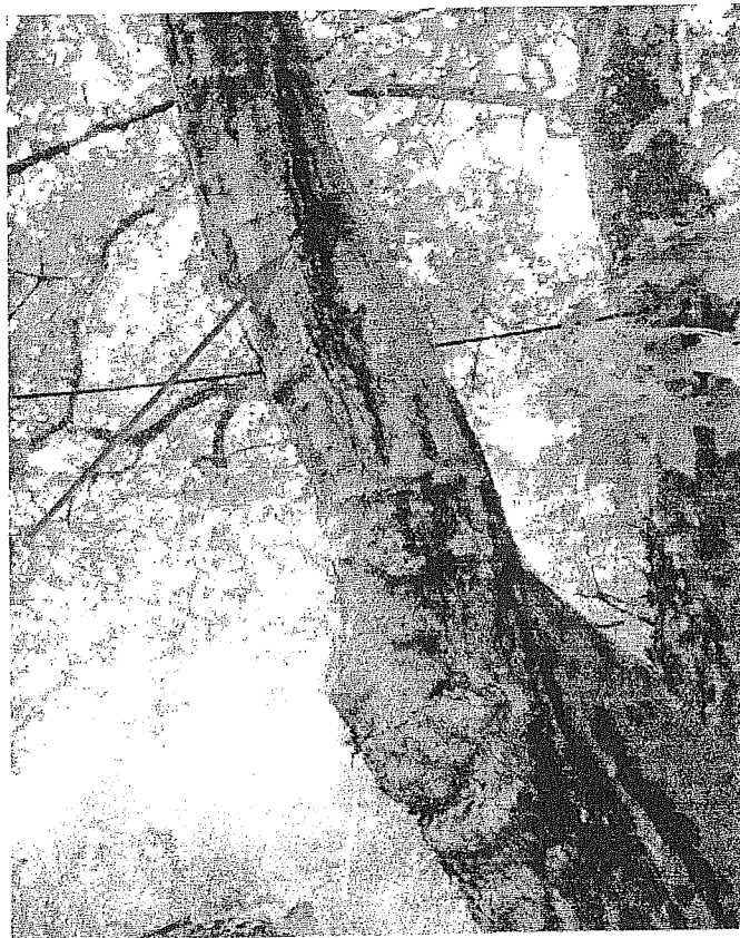
Abb. 16: Risse und Rippen.