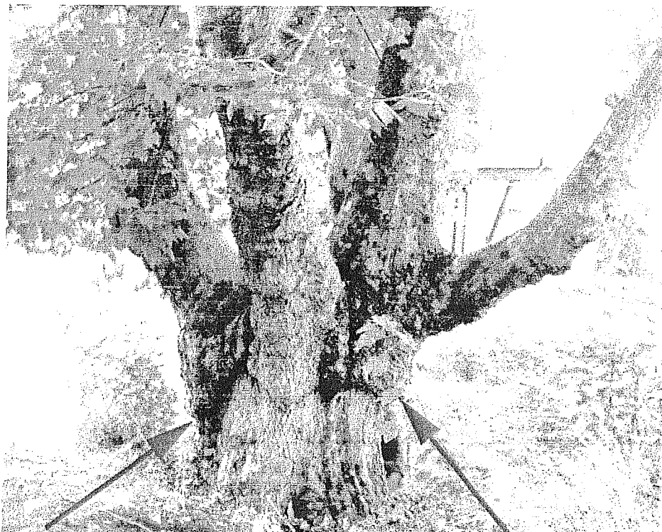
Abb. 18: Bis in den Stammfuß herabquellende Stauchungen.