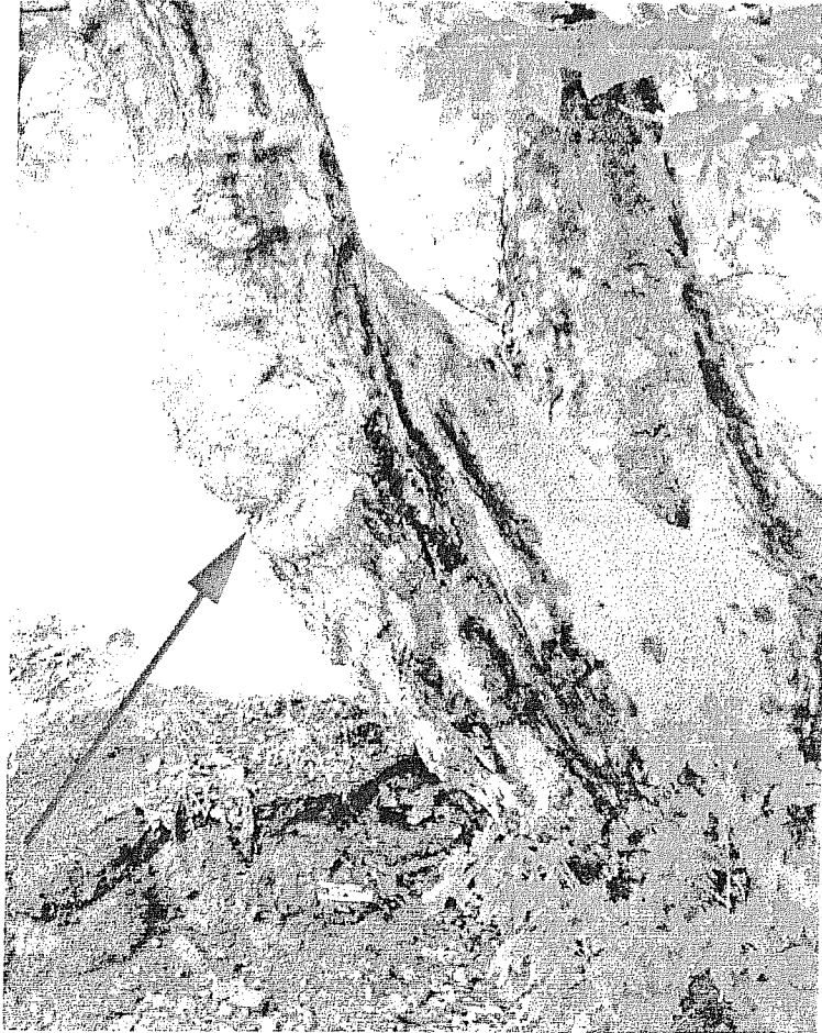
Abb. 17: Deutliche Holzstauchungen als Folge der Absenkung der Stämmlinge.